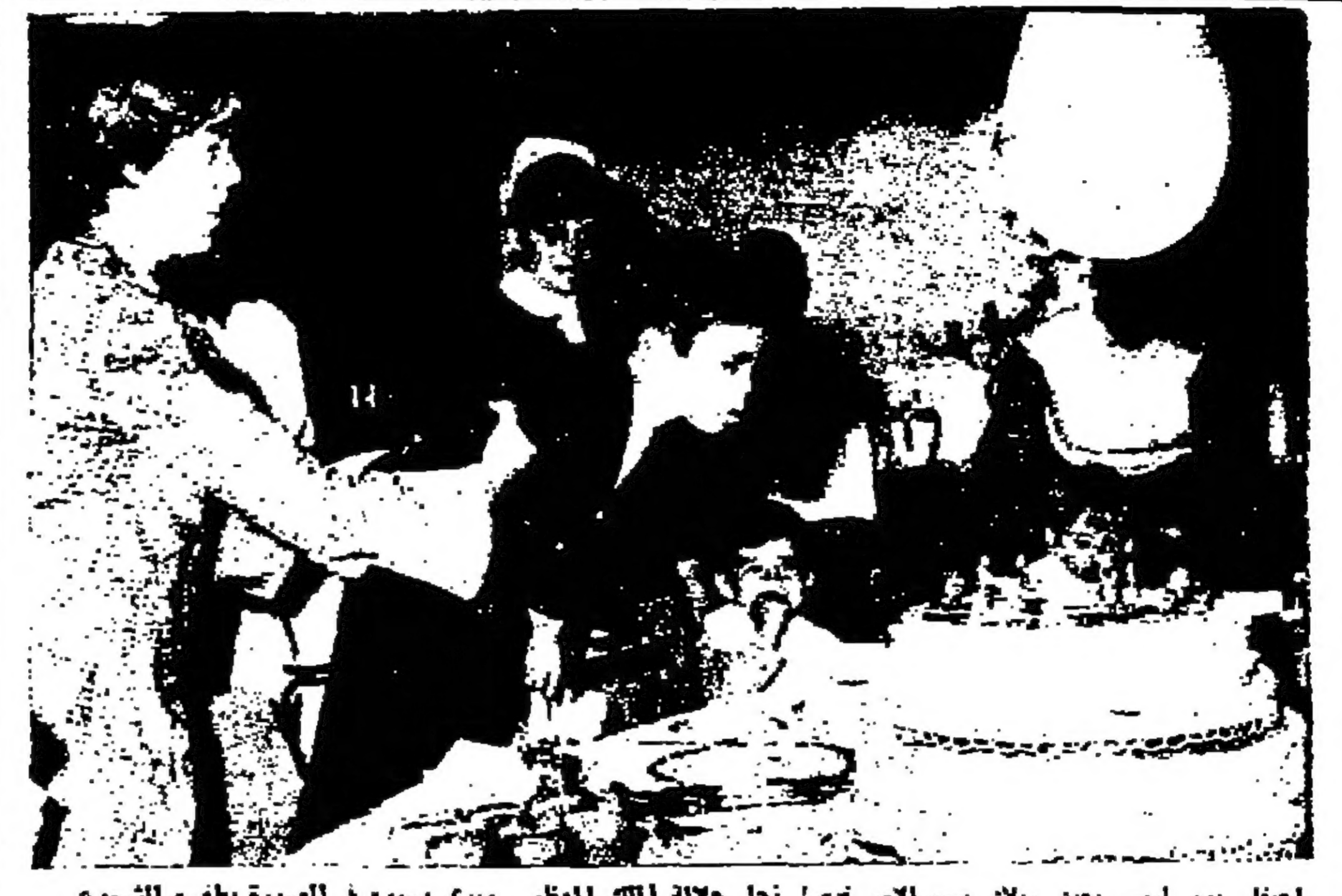
أهل يوه امس بعد ذلك سوا الأجر تحمل نجل جلالة الملك العظيم - ويرى سواد في الصورة بطرفه الشروع خلال الإحتفال الذي أقيم بالشمسة السيدة

الركاب العرب يوقعون من مضيافا لظائرا نفس الضيافة والجرم الذي يلاقونه في منازلهم! إن يكون اضمام الضيافة مركزا عليهم - وتقول الضيافة أن الضيافة المستنسخ أن تعرف نورا وكلمها العرب - فهم مستقون بأصابعهم أو ينادون جنف - اقلية - معتقد الضيافة العميلات في الطائرات ان الركاب الرجال من العرب يريدون أن عمل الضيافة على انديامهم وخدمتهم والاحكام بهم - وقد برز هذا الاستنساخ من مؤتمرا عقده هنا حوالي سبعين ضيفه من 18 شركة طيران عالية لالحت في شركتين المستركة وهي الراكب - وبين الضيافة ممثلات عن شركة الخطوط الجوية الملكة الأردنية، وطران الشرق الأوسط والخطوط الجوية السعودية والخطوط الجوية الكويتية - وأبلغ عدد من الضيافة المؤتمرا ان الركاب العرب يتوقعون من الضيافة الضيافة ذاتها والجو العظيم السلي فيقونه في منازلهم - وبعض الركاب العرب هم من الرجال الذين يجسسون منة في التعليم الشخصي ويتفرسون